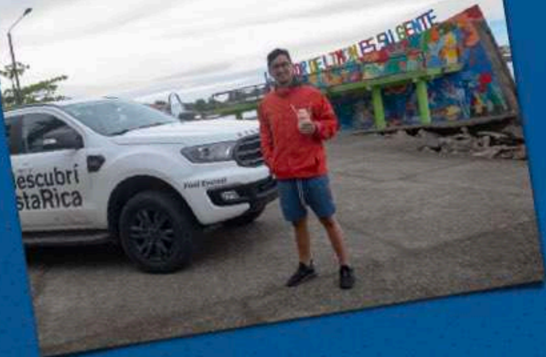
PARQUE DE LIMÓN CON BUEN GRANIZADO