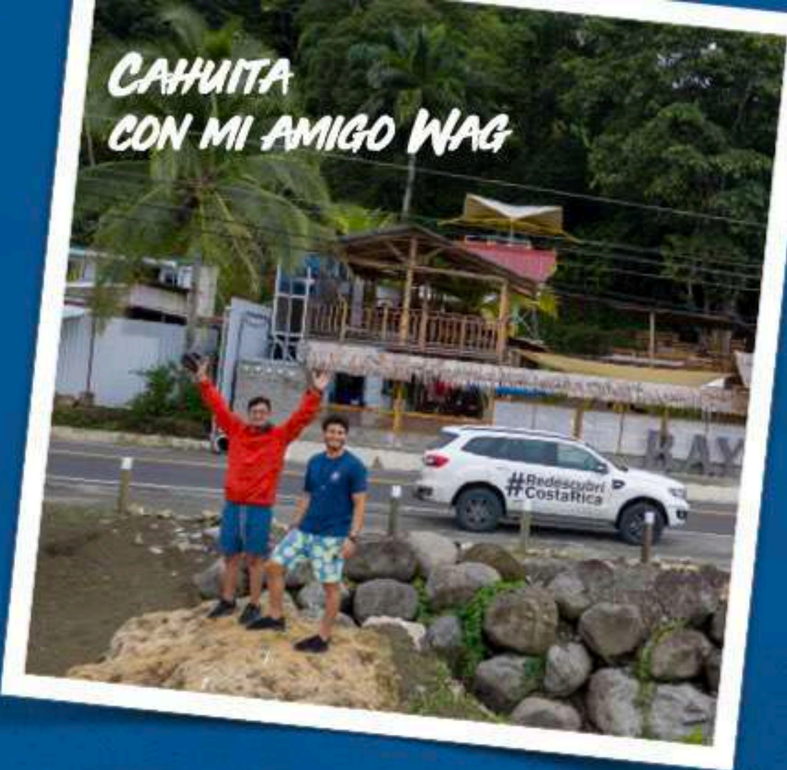
CAHUITA CON MI AMIGO WAG