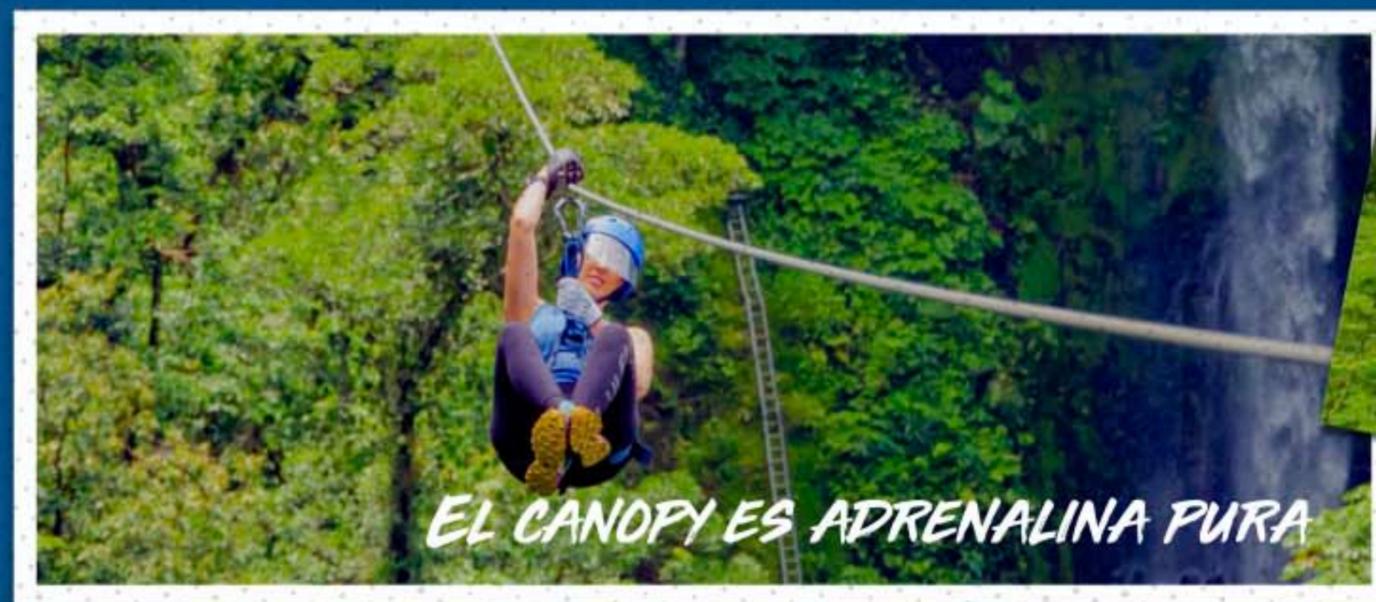
EL CANOPY ES ADRENALINA PURA