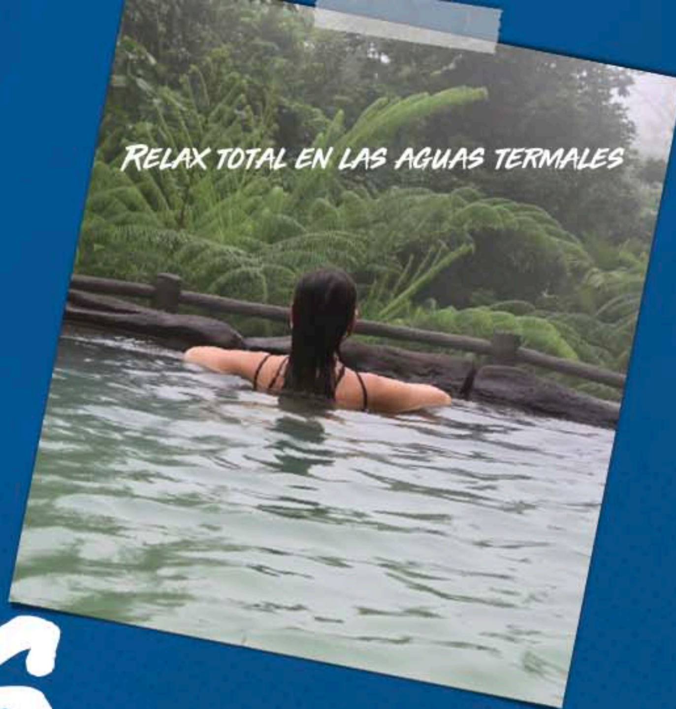
RELAX TOTAL EN LAS AGUAS TERMALES