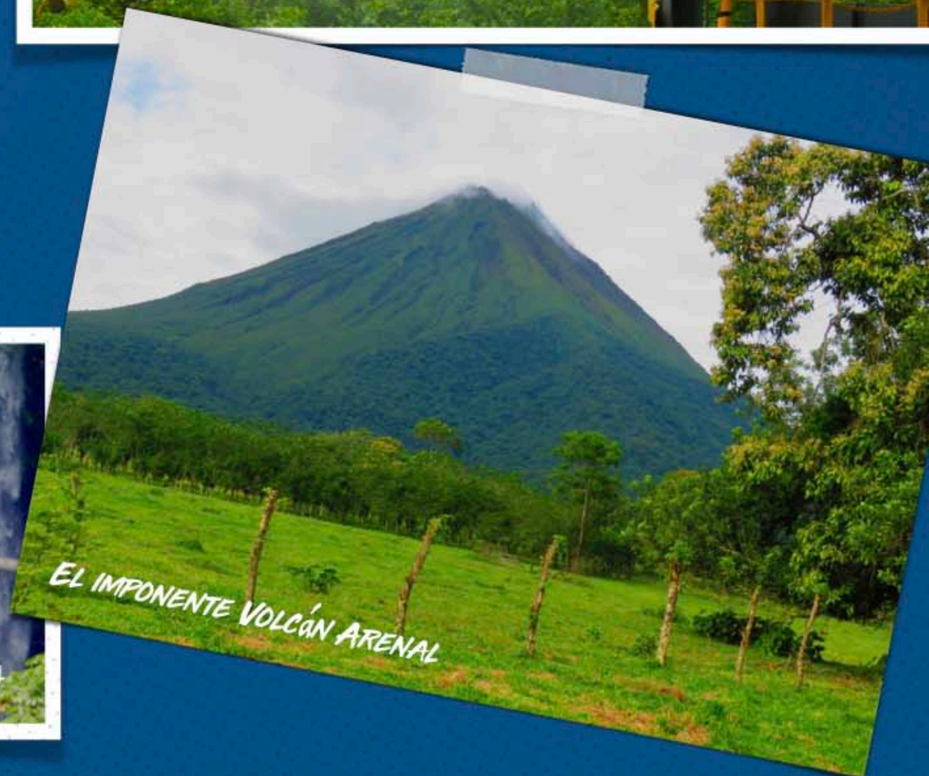
EL IMPONENTE VOLCÁN ARENAL