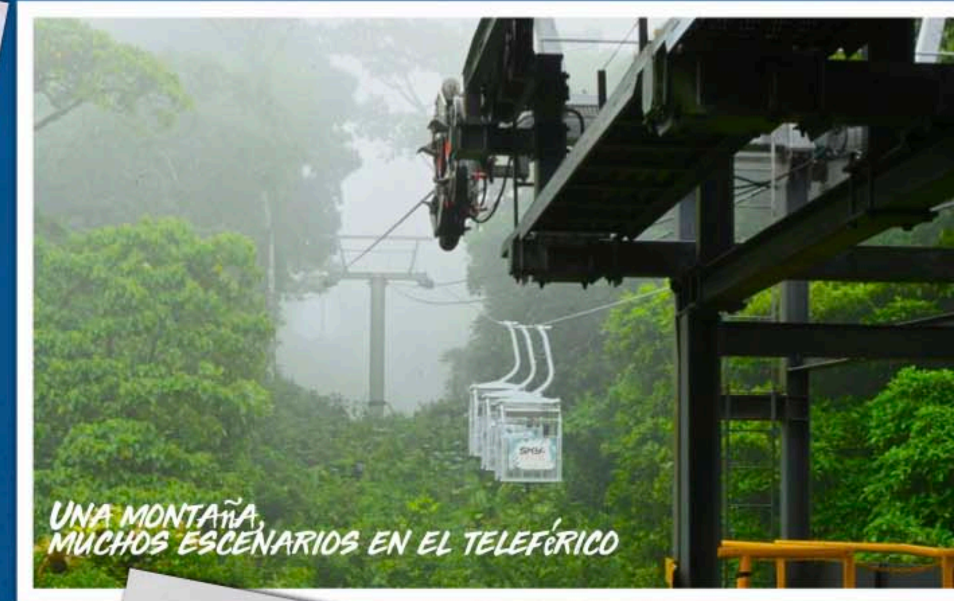
UNA MONTAÑA, MUCHOS ESCENARIOS EN EL TELEFÉRICO