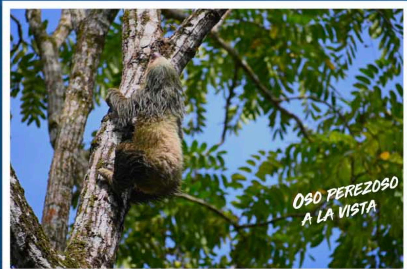
OSO PEREZOSO A LA VISTA